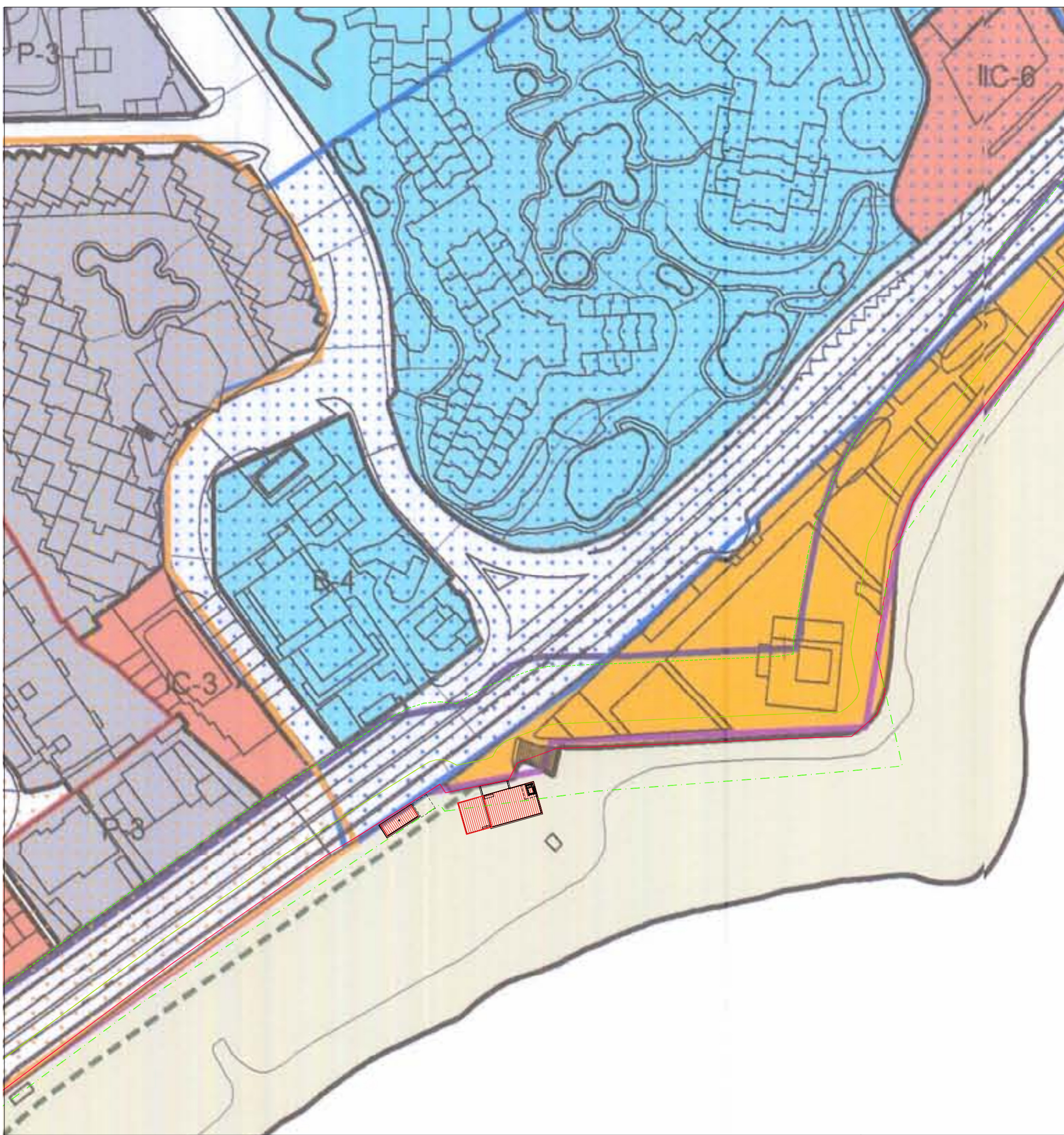
ZONIFICACIÓN SEGÚN EL P.G.O.U. ESCALA: 1/1000