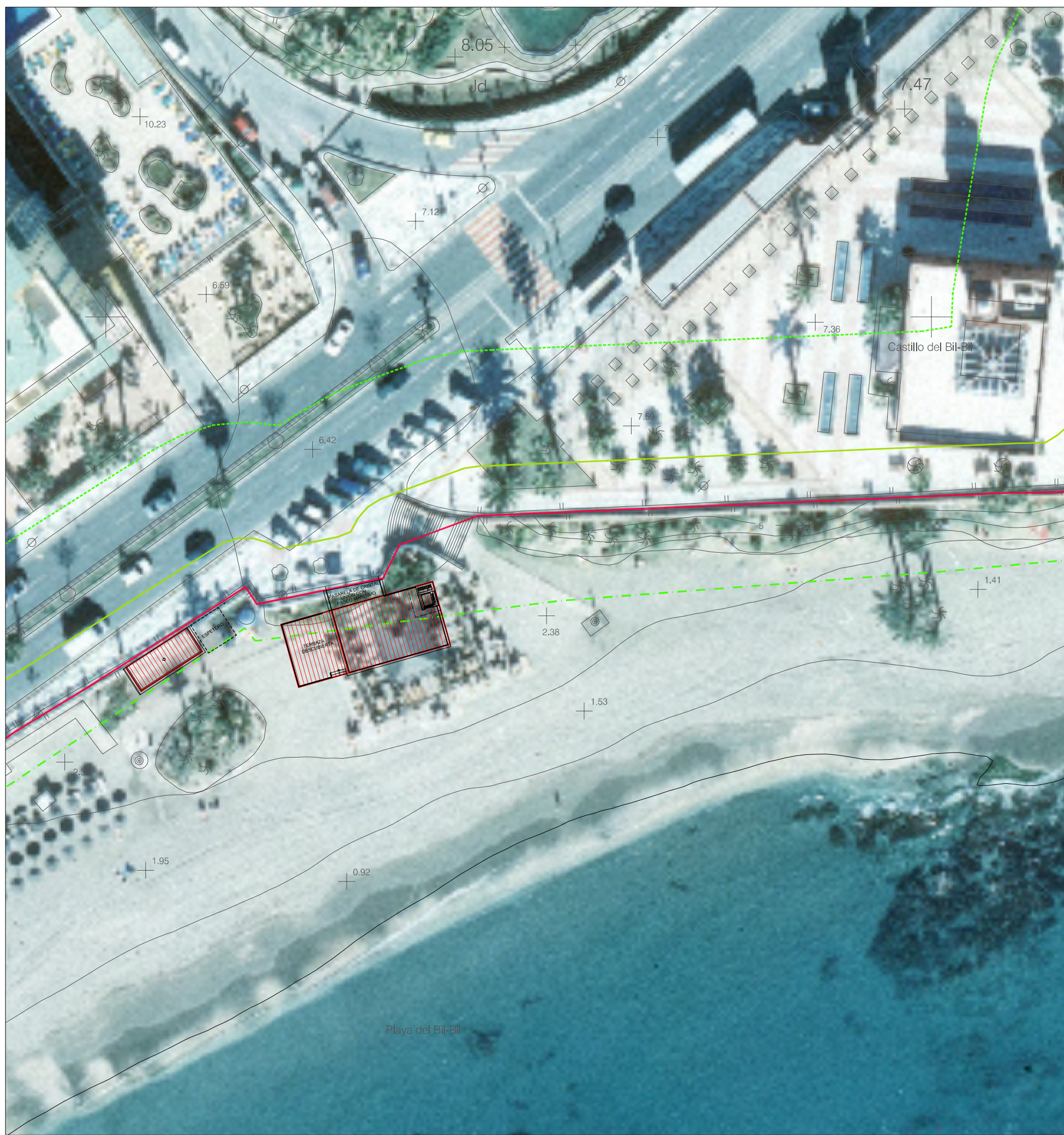
EMPLAZAMIENTO EN ORTOFOTO ESCALA: 1/500