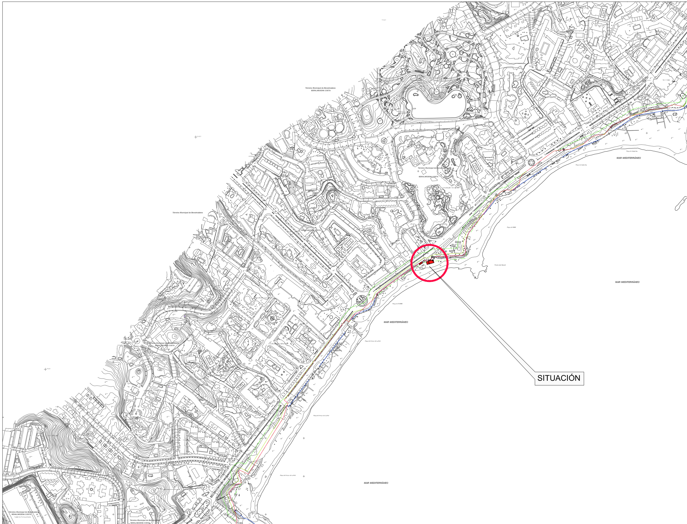
SITUACIÓN EN TOPOGRÁFICO ESCALA: 1/5000